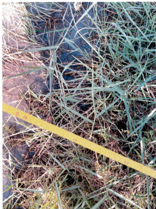
วัดความกว้างหลังขุดลอกคลอง