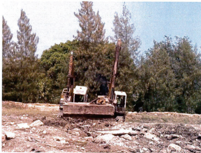
เคลื่อนย้าย ปิยะบรรทุกแมคโครชุดดินลงคลอง