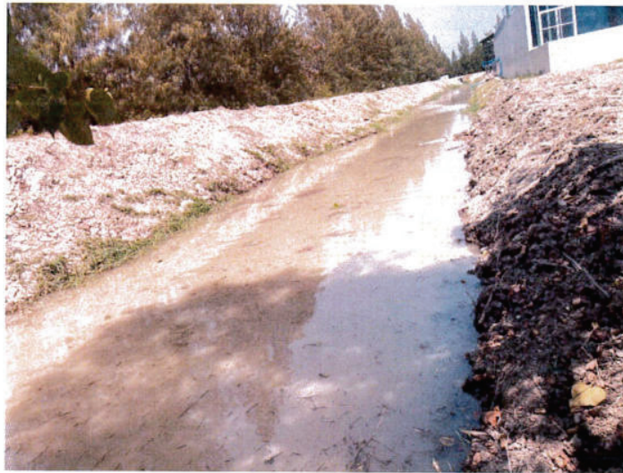
หลังขุดลอกคลอง สถานีสูบน้ำ 2 ถึง สถานีสูบน้ำ 1