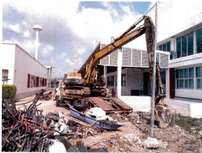
รถแมคโคร ขนาด PC120