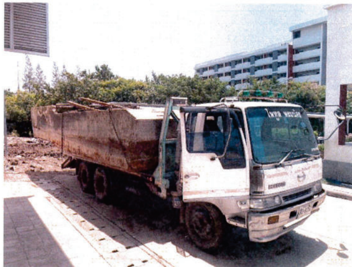
รถขนย้าย โป๊ะบรรทุกรถแมคโครขุดดิน

บริษัท เค แอนด์ พี ไฮดรอ- เมคค อควิปเมนต์ จำกัด ได้ทำการนำเครื่องจักรเข้าพื้นที่เพื่อดำเนินการขุดลอก คลองสถาบันการแพทย์จักรีนฤเบดินทร์ ระยะ 600 เมตร โดยมีโป๊ะบรรทุกรถแมคโครขุดดิน 1 ลำ และ รถแมคโครขุดดิน PC120 1 คัน รถแมคโครขุดดิน PC60 1 คัน พร้อมทั้งตรวจเอกสารเกี่ยวกับเครื่องจักร และ เครื่องมือต่างๆ