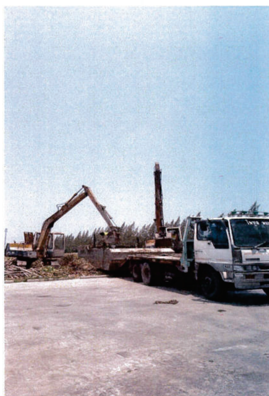
ขนย้ายเครื่องจักรออกพื้นที่ทำงานหลังเสร็จทันที