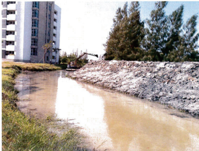
ตักแต่งคันดิน