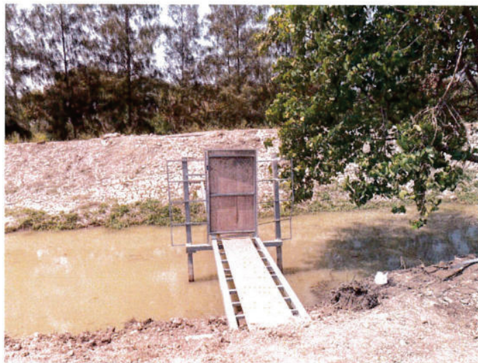
สะพานกลับมาใช้งาน ได้ปกติ