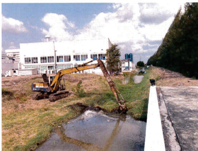
บริเวณสถานีสูบน้ำ 2