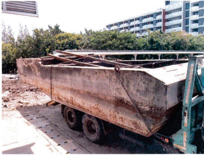
ปี๊บบรรทุกกรรเมคโครชุดดิน