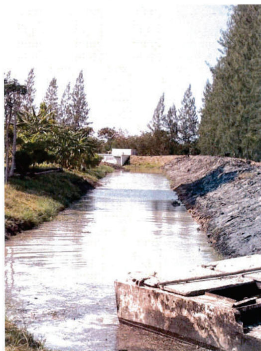
หลังขุดลอกคลอง หลังหอพัก 5