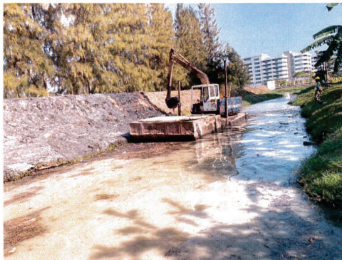
ปรับคันดินที่พังทลาย