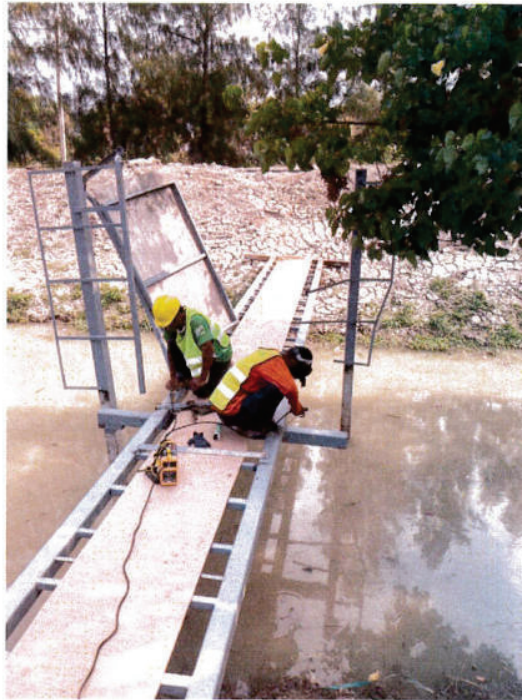
ทำการติดตั้งสะพาน สถานีสูบน้ำ กลับตำแหน่งเดิม