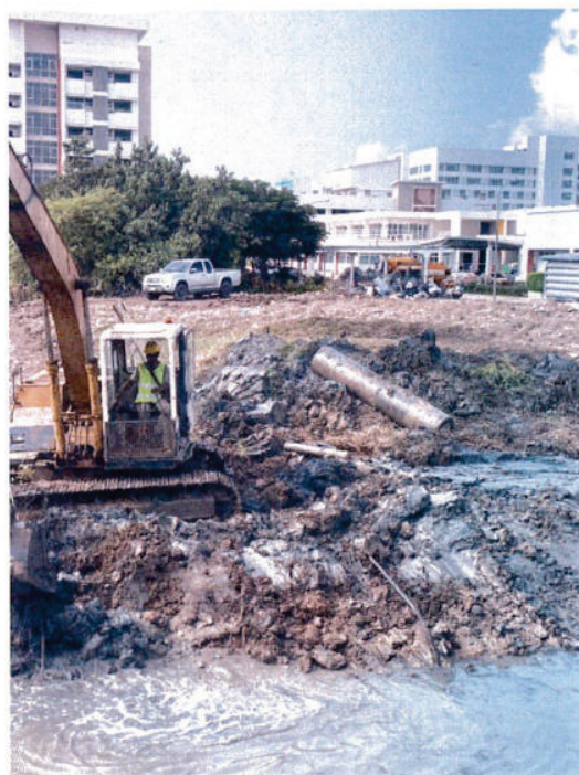
เศษวัสดุในคลอง สถานีสูบน้ำ 2