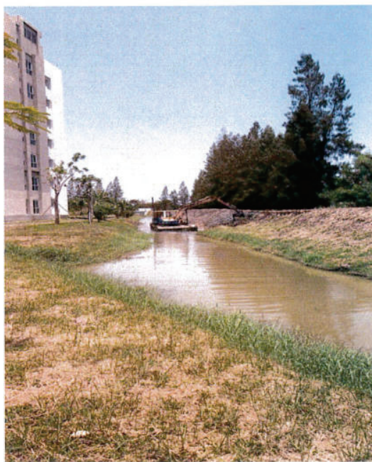
ก่อนขุดลอกคลอง หลังหอพัก 5