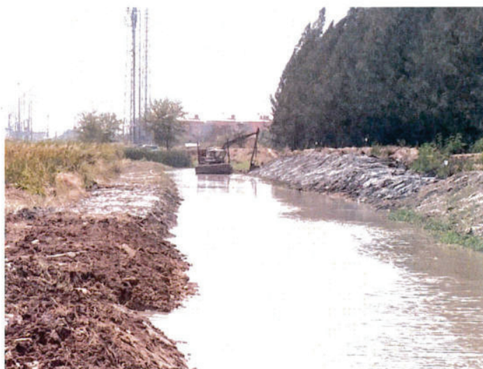
ทำการขุดลอกคลองที่ระยะ 600 เมตร