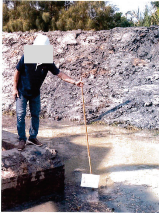
วัดความลึกถึงชุดลอกคลอง