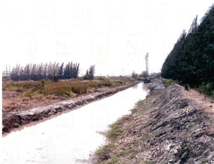
ขุดลอกคลอง ครบระยะ 600 เมตร พร้อมตกแต่งคันดิน