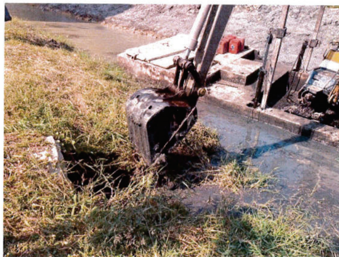
เปิดช่องทำระบายน้ำทิ้ง