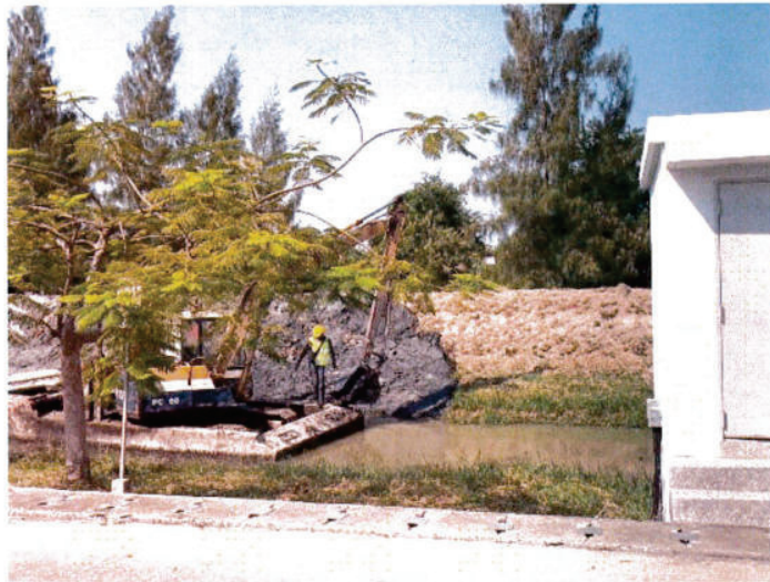
เริ่มขุดลอกคลองที่จุดเริ่มต้น สถานีสูบน้ำรดต้นไม้หอพัก 5