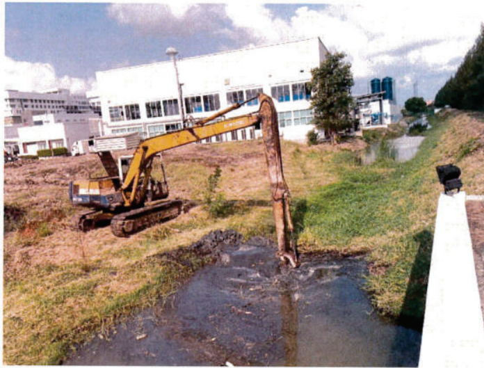
ก่อนขุดลอกคลอง สถานีสูบน้ำ 2 ถึง สถานีสูบน้ำ 1