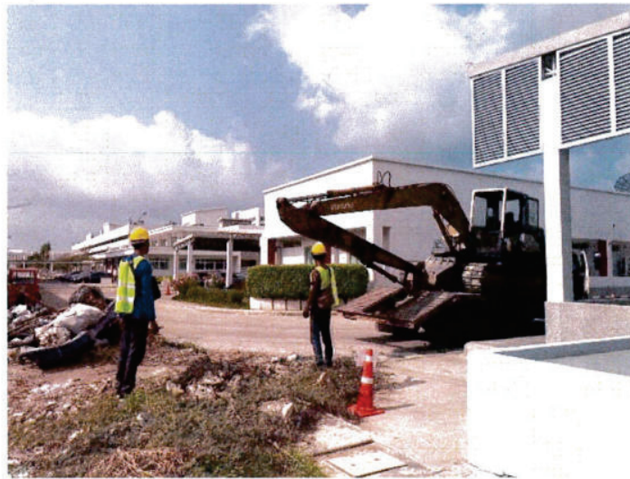
รถแมคโคร ขนาด PC60