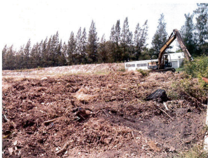
ทำการเตรียมพื้นที่บริเวณ โรงพักขยะ